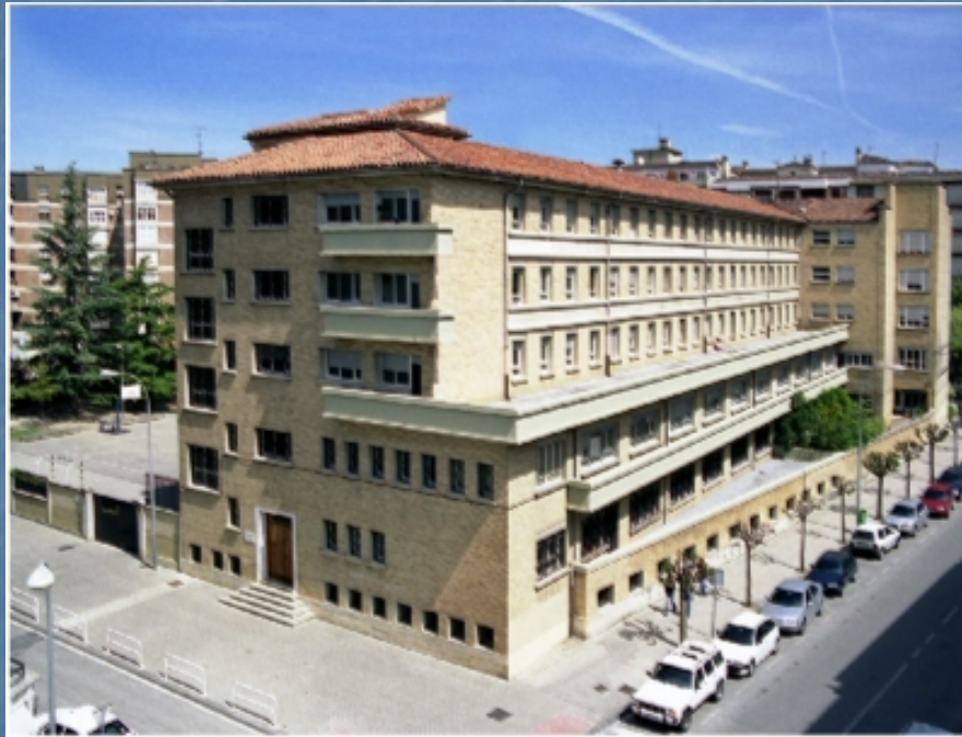
Colegio Santísimo Sacramento Pamplona